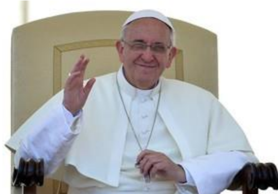
האפיפיור פרנציסקוס. התרשם מבית הספר

כשנציגי עמותת "יד ביד", המקדמת שיתוף פעולה יהודי-ערבי באמצעות חינוך רב-תרבותי, פנו במכתב לאפיפיור פרנציסקוס וביקשו ממנו לבקר בבית הספר הדו-לשוני בירושלים, הם לא האמינו שיזכו לתשובה.